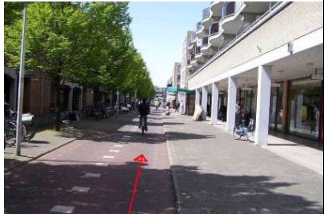
Ga vanaf het wijkcentrum linksaf en fiets over de Lenteakker in de richting van de Zomerakker