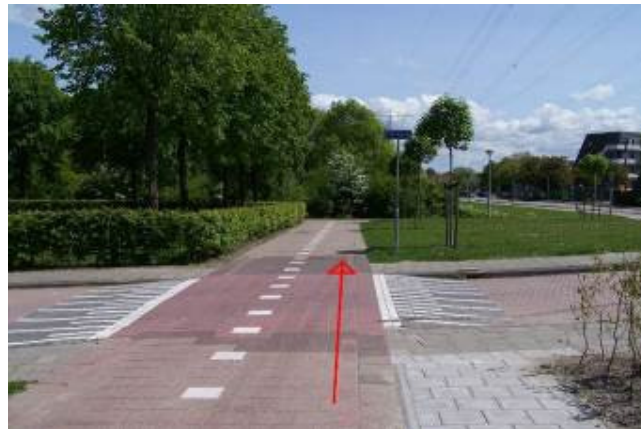
Fiets verder over dit fietspad en...