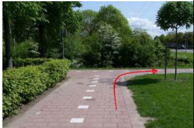
...ga bij de T-splitsing rechtsaf