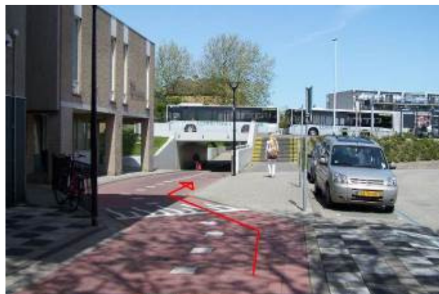
Ga onder de fietstunnel door