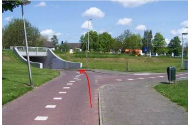
Ga onder de fietstunnel door