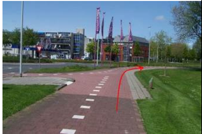
Houd bij de rotonde rechts aan