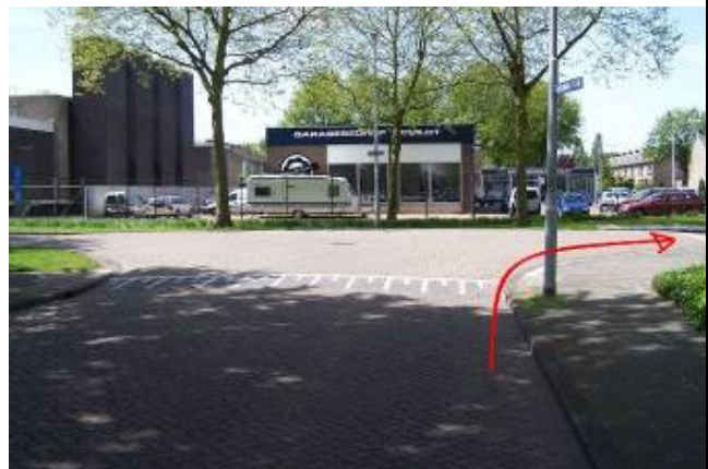
Ga aan het eind rechtsaf de Galileilaan op