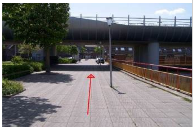
Ga rechtdoor onder de spoorbrug door