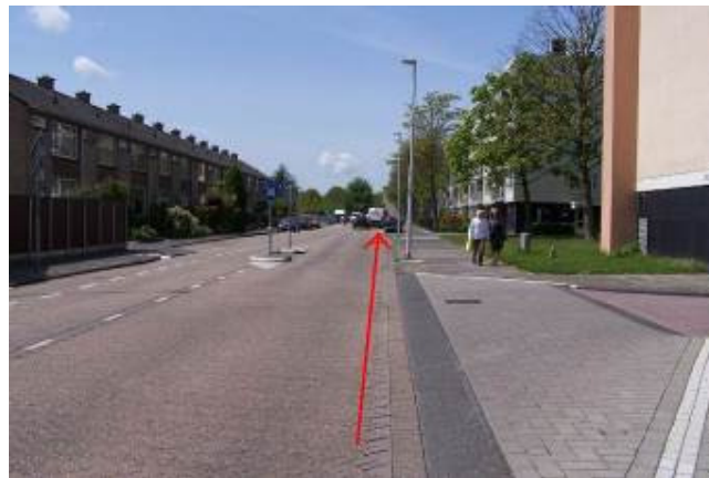
Fiets rechtdoor over de Planetenlaan