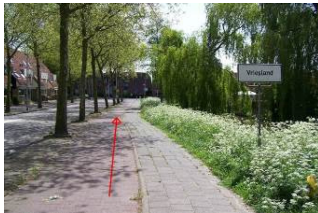
Fiets langs het Buntgras