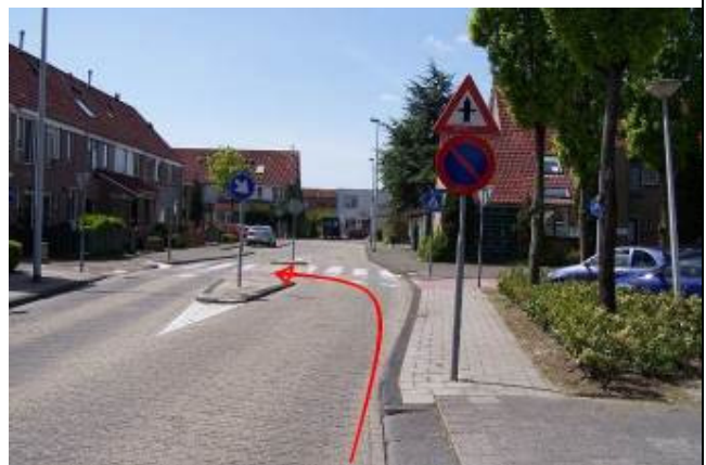
Steek bij het fietspad over en ga linksaf het fietspad – Kweldergras – op