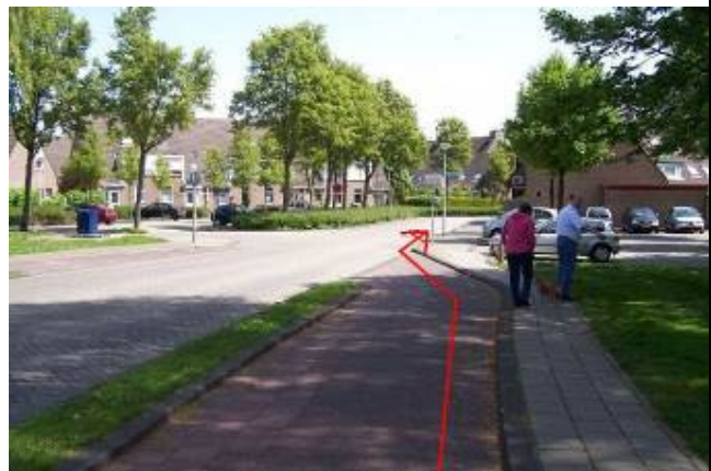
Fiets over de Akkersvoorde