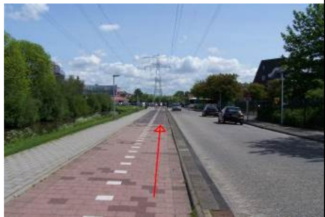
Fiets langs het Schaduwgras rechtdoor naar het winkelcentrum