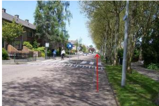
Fiets door de Galileilaan helemaal tot het einde