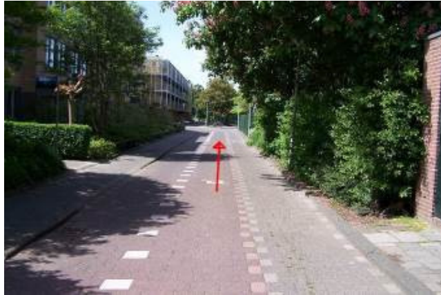
Fiets langs de school over de Verdilaan