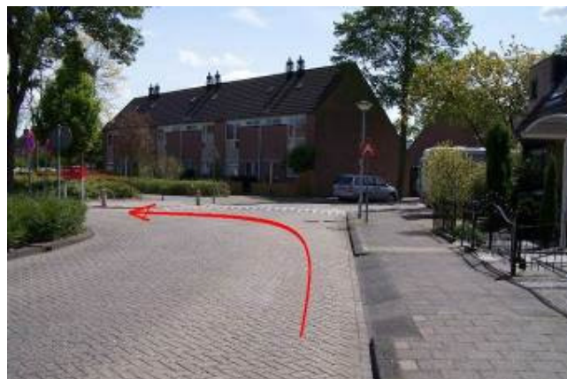
Ga linksaf de Ploegvoorde in