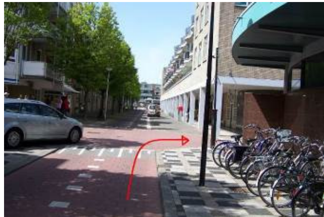
Ga op de Zomerakker rechtsaf in de richting van de fietstunnel