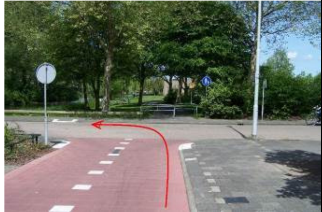
Ga aan het eind linksaf de Saturnusstraat in