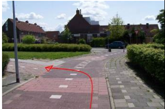
Ga, voordat je bij het Schaduwgras bent, linksaf het fietspad op