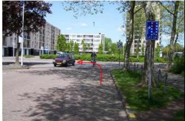
Ga aan het eind linksaf de Planetenlaan op