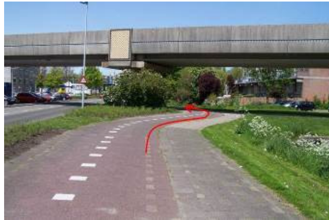
Fiets rechtdoor onder het spoorviaduct door