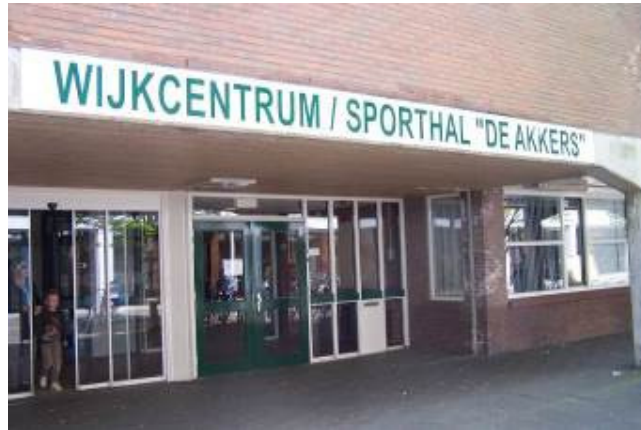
Het startpunt van de route is wijkcentrum "De Akkers", Lenteakker 5