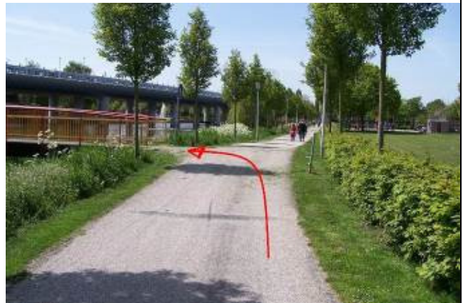
Ga bij de eerste brug linksaf...