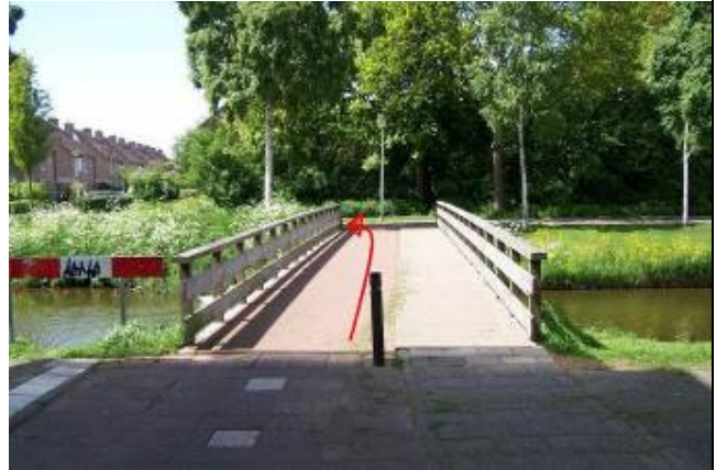
Fiets aan het eind over de brug en ga daarna linksaf