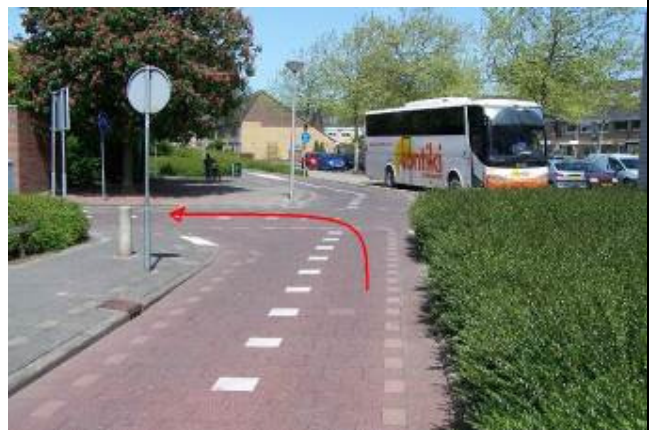
Ga linksaf de Verdilaan in