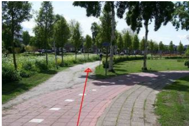
Houd links aan en volg het schelpenpad (onverplicht fietspad)