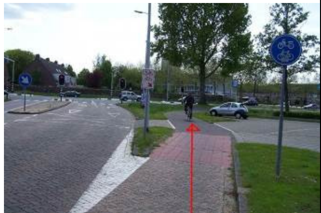
Ga het vrijliggende fietspad op