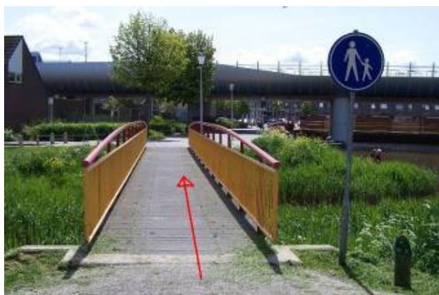
...en steek deze eerste brug lopend over