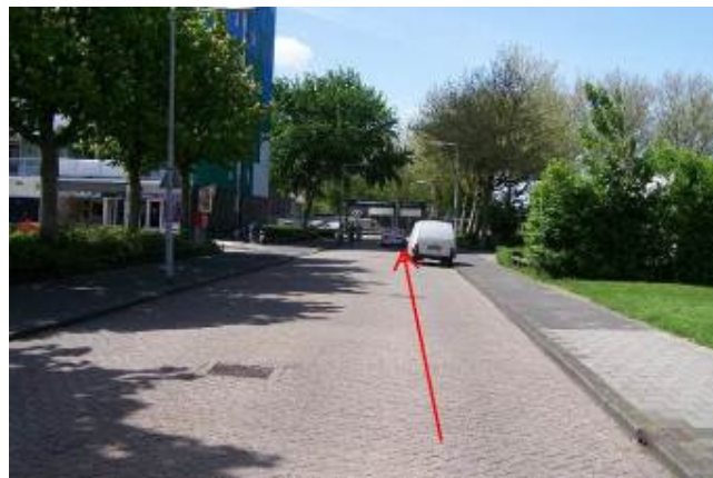
Fiets door de Saturnusstraat in de richting van de Galileilaan