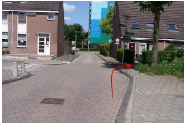
Ga rechtsaf de Schopvoorde in