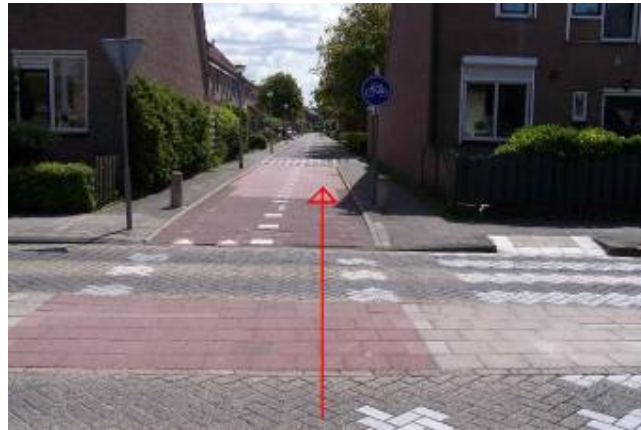
Fiets verder over het Kweldergras