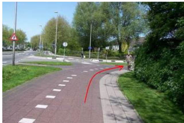
Ga rechtsaf de Akkersvoorde op