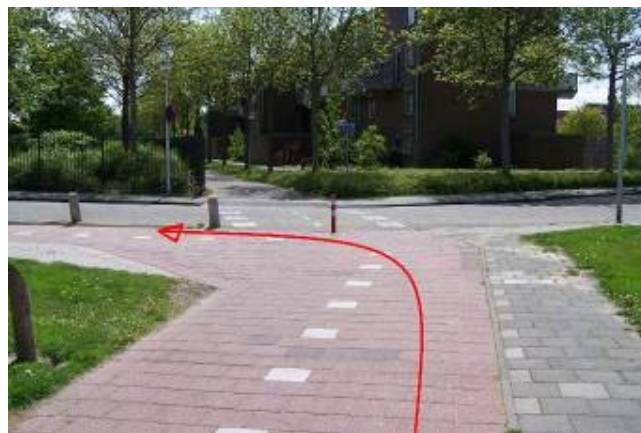
Ga voor het Schaduwgras linksaf, blijf op het fietspad