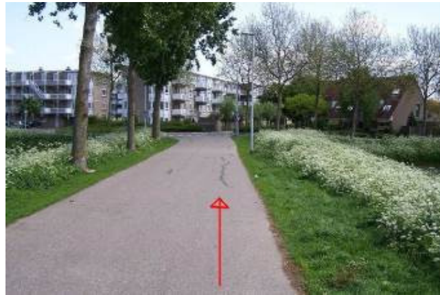
Fiets over de Westdijk in de richting van het Buntgras