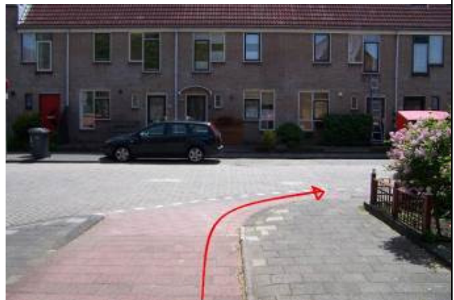
Ga bij de T-splitsing rechtsaf