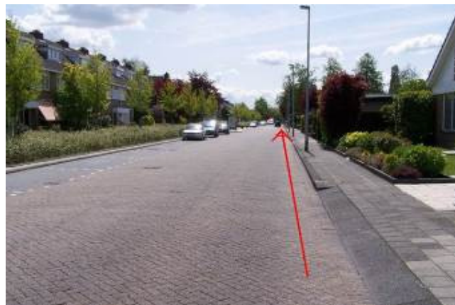
Blijf rechtdoor rijden op de Copernicuslaan tot aan de Heemraadlaan (verkeerslichten)