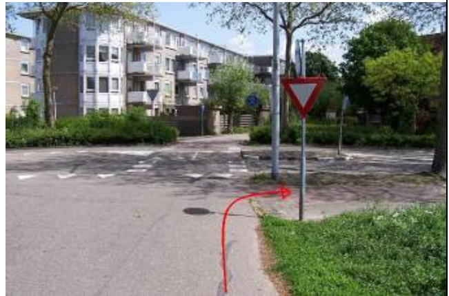
Ga op het Buntgras rechtsaf