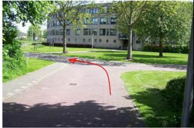
Ga bij de T-splitsing linksaf in de richting van de fietstunnel