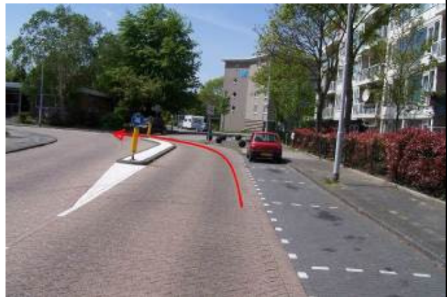
Blijf aan het eind de weg volgen, je houdt links aan en gaat de Copernicuslaan op