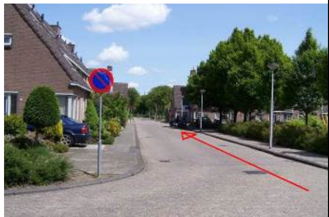
Fiets door de Ploegvoorde