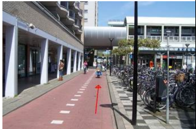
Fiets over de Zomerakker in de richting van de fietstunnel