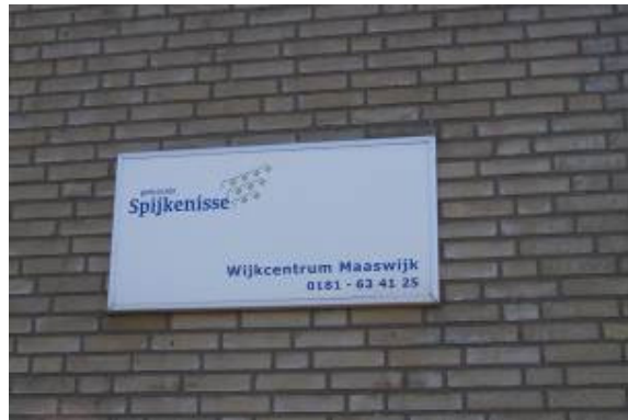
De route start bij wijkcentrum "Maaswijk", M. Rutgers-Hoitsemastraat 2