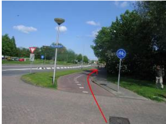
...fiets helemaal door tot het winkelcentrum