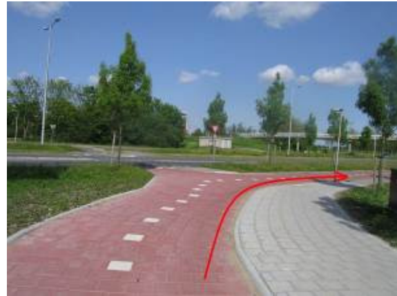
Houd rechts aan en fiets langs de Maaswijkweg in de richting van de fietsbrug