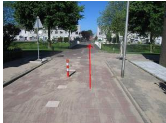
Ga rechtdoor over het Anna Reijnvaanpad