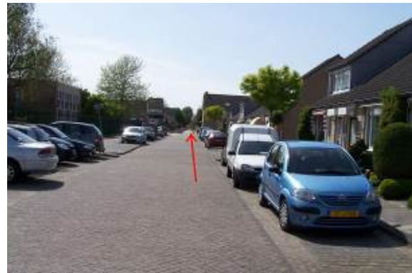
Fiets vanaf het wijkcentrum in de richting van de Wilhelmina Bladergroenstraat