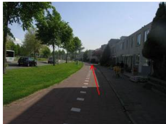
...en de Mies van Oort-Laustraat...