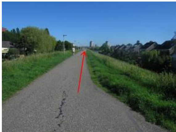
Fiets over de Gaddijk in de richting van de Maaswijkweg