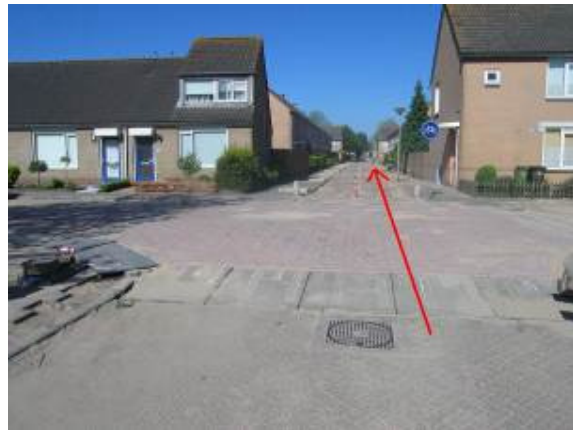
Steek de Wilhelmina Bladergroenstraat over