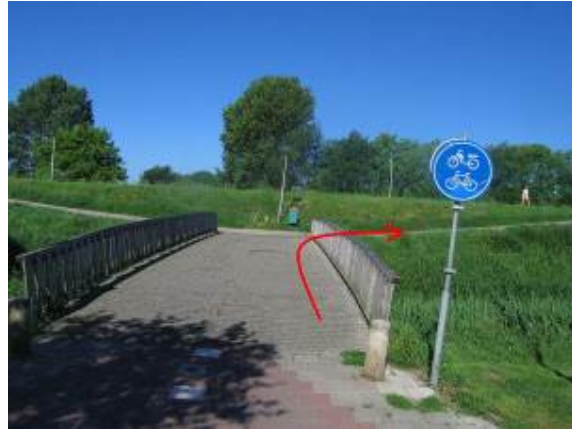
Fiets over de brug en ga rechtsaf de Gaddijk op