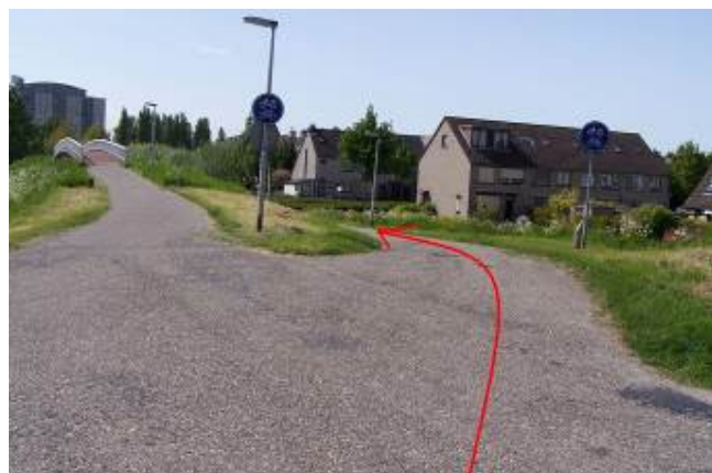
Houd het meest rechter fietspad aan. Je gaat nu, rechts naast een brug, naar beneden!!