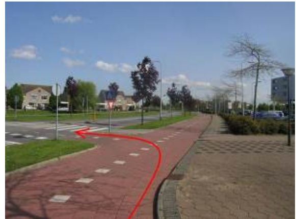
Ga daarna direct linksaf en ...