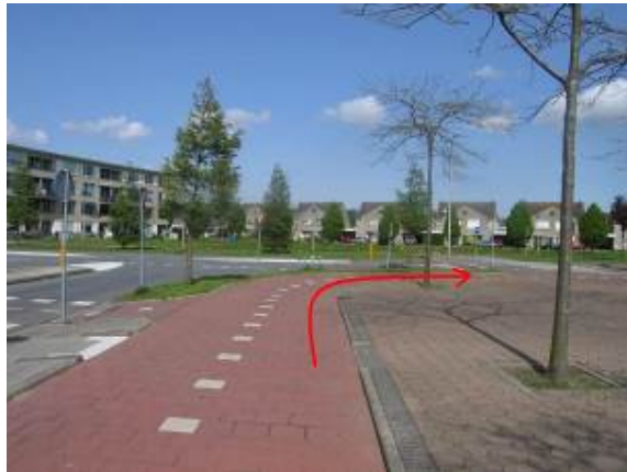
Ga aan het eind, bij de Annie Romein-Verschoorlaan, rechtsaf