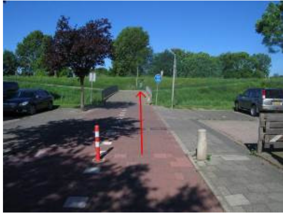
Aan het eind van het Haya van Someren-Downerpad kom je uit bij de dijk