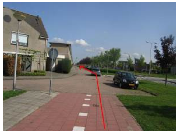
Fiets rechtdoor over de Lucretia van Merkenstraat