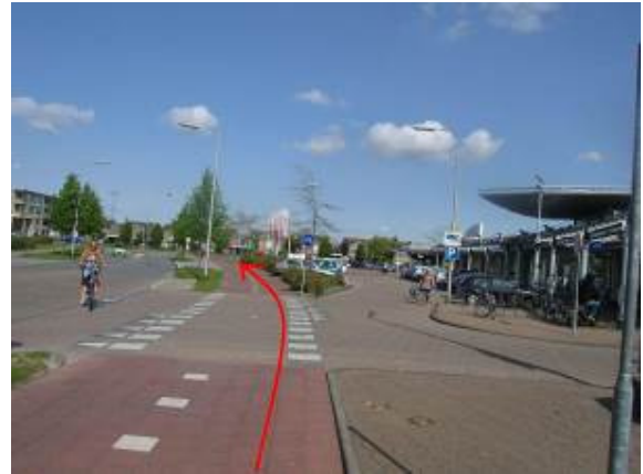
Fiets rechtdoor langs het winkelcentrum