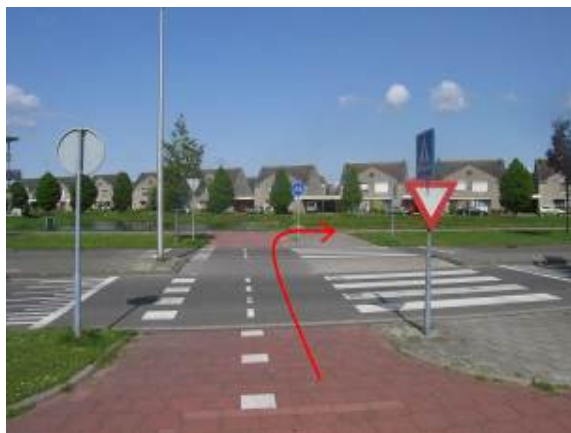
...steek de Annie Romein-Verschoorlaan over. Ga na het oversteken rechtsaf