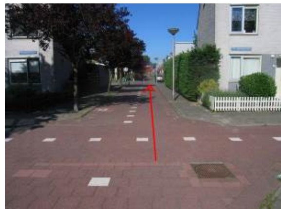
Ga rechtdoor het Haya van Someren-Downerpad op