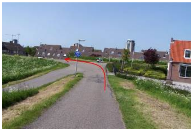
Ga na de brug linksaf