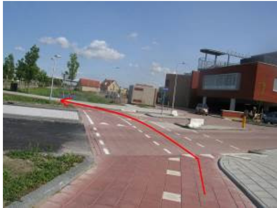
Blijf het fietspad om de rotonde volgen