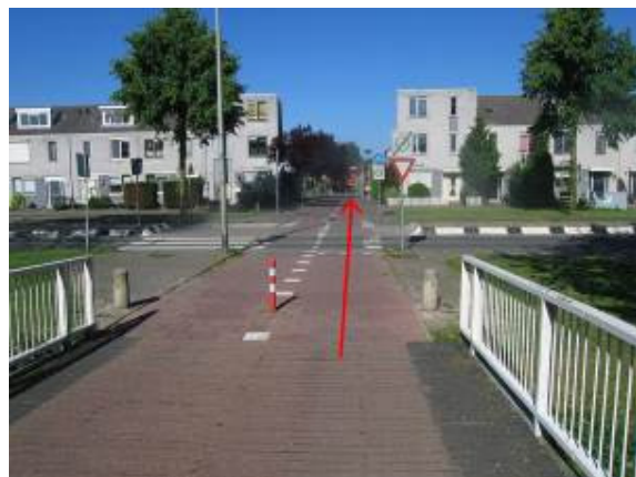
Steek rechtdoor de Joke Smitlaan over