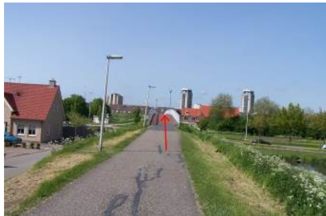
Ga via de brug de Maaswijkweg over