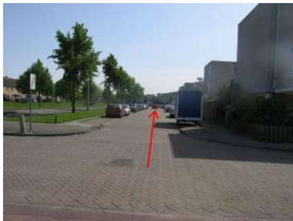
Blijf rechtdoor fietsen, door de Suze Groenewegstraat, de Mina Krusemanstraat...