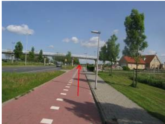
Blijf rechtdoor langs de Maaswijkweg fietsen en ga onder de fietsbrug door