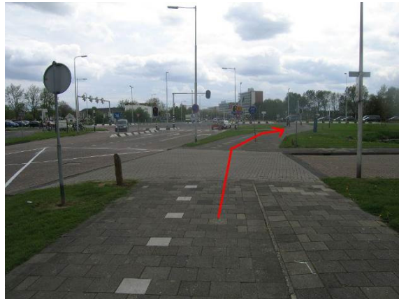
Fiets naar de verkeerslichten op het kruispunt Winston Churchilllaan / Groene Kruisweg