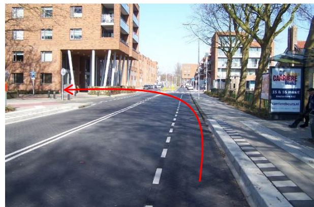
Ga de eerste straat linksaf de Hoogwerfsingel in