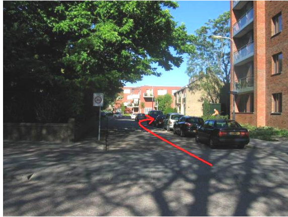
Ga in de Hoogwerfsingel ...