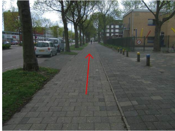
Fiets langs de Winston Churchilllaan in de richting van de Groene Kruisweg