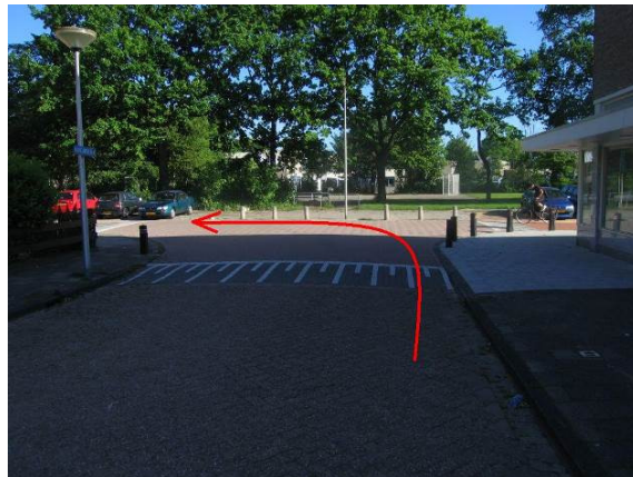
Ga aan het eind van de Madeliefstraat, bij de T-splitsing, linksaf de Lisstraat in