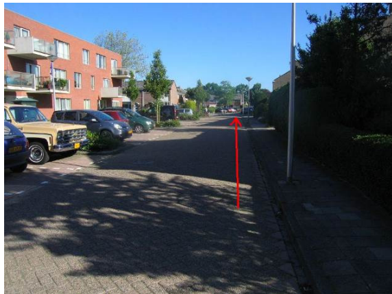
...de Madeliefstraat in.