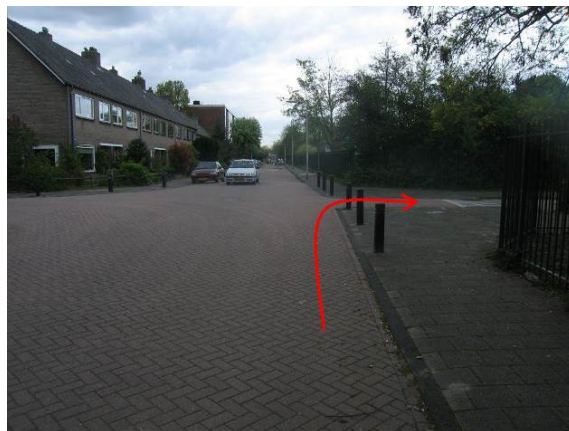
..de eerste weg rechts, de Geraniumstraat, in.