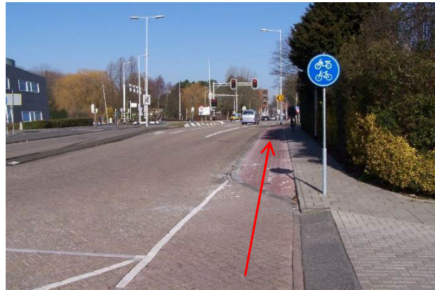
Ga het vrijliggende fietspad op