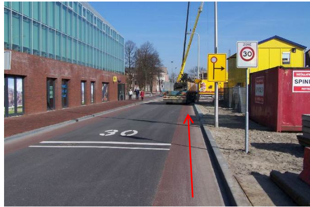
De Eerste Heulbrugstraat...