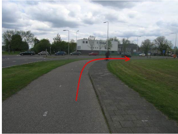
Volg het fietspad langs de Hekelingseweg