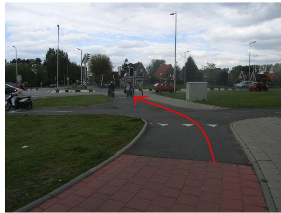
Steek bij de verkeerslichten de Groene Kruisweg over