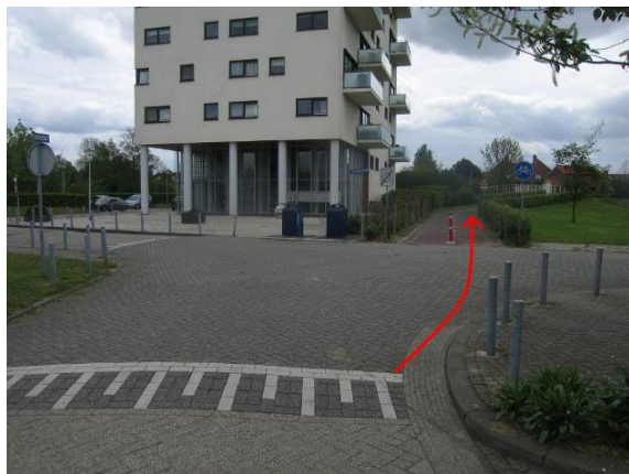
Steek de J. De Baanlaan over en ga rechtdoor het fietspad op