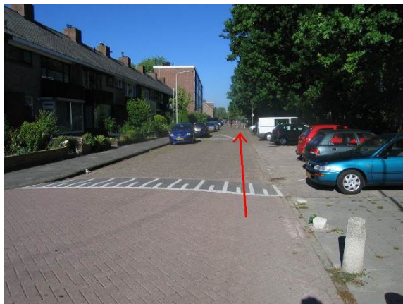
Ga in de Lisstraat...