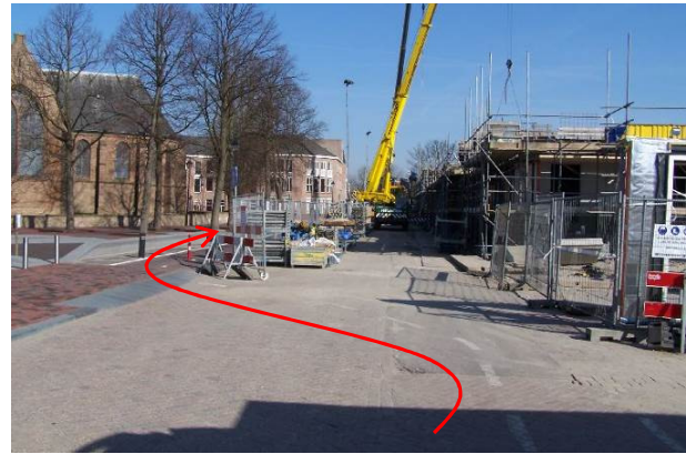
... de Eerste Heulbrugstraat...