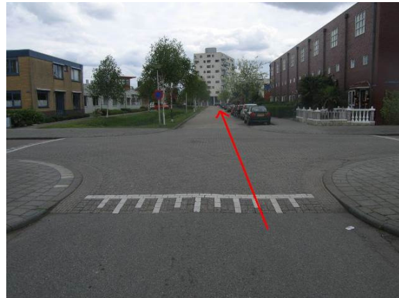
Fiets rechtdoor door de Zinkseweg