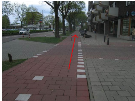
Blijf rechtdoor langs de Winston Churchilllaan fietsen