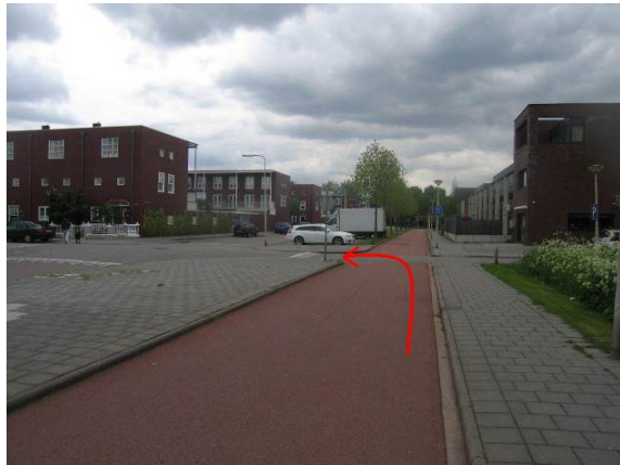
Ga linksaf, steek de Heijwegelaan over en ga de Zinkseweg in