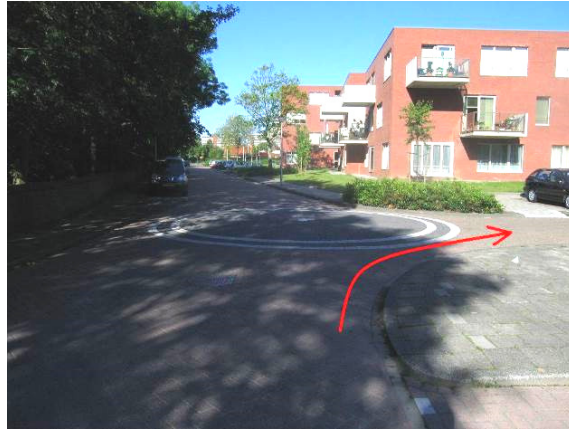
...de eerste straat rechtsaf...