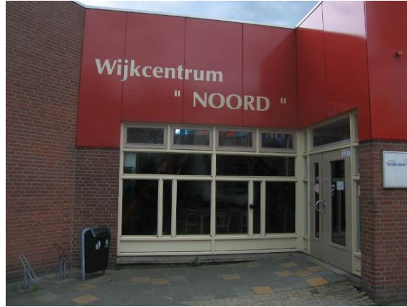
De route begint bij wijkcentrum "Noord" aan de Winston Churchilllaan 27