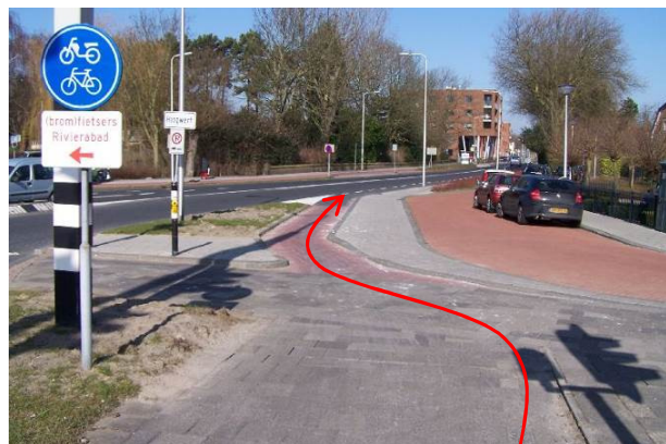
Fiets na het oversteken rechtdoor de Rozenlaan in