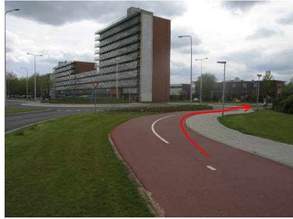
Ga bij de rotonde rechtsaf de Heijwegelaan in (bij sporthal Den Oert)