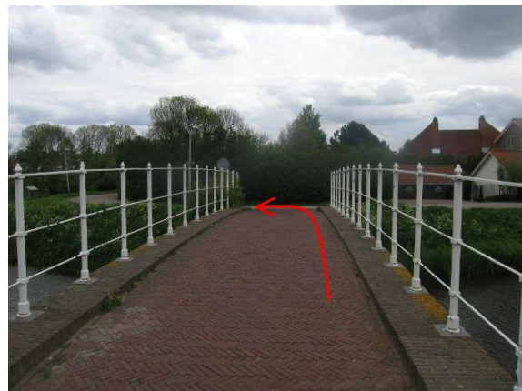
Ga na de brug linksaf de Breekade op