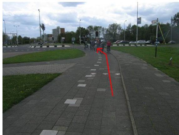
Steek bij de verkeerslichten de Groene Kruisweg over